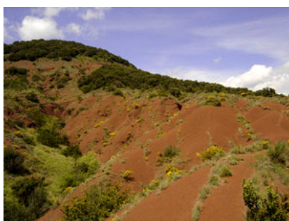
Les berges du lac : la ruffe ravinée par l'érosion (avril 2006).