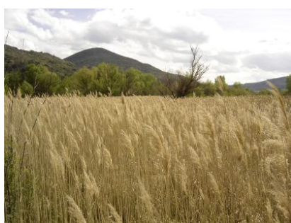
La roselière, à l'embouchure de la rivière Salagou (avril 2006).