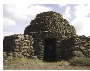
Une remarquable capitelle à degrés, sur le plateau d'Auvergne (avril 2006).