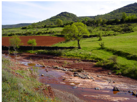
La rivière du Salagou dans sa vallée bucolique (avril 2006).