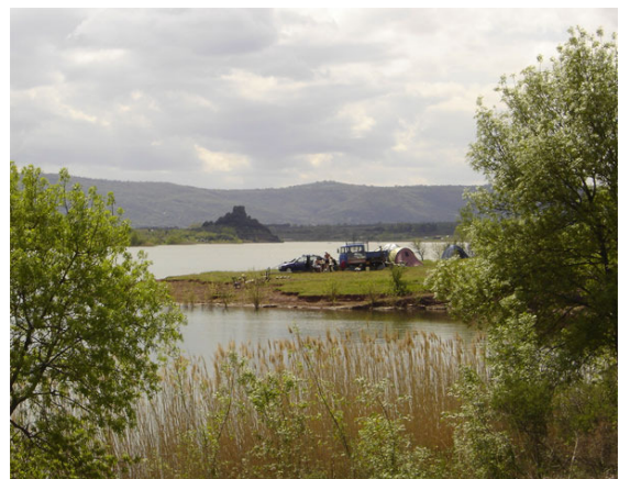
Les berges du lac, régulièrement colonisées par les campeurs (avril 2006).