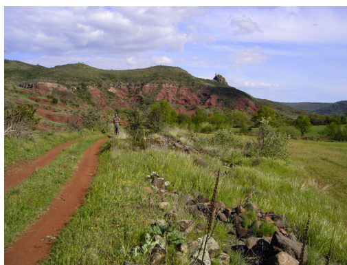
paysages étranges et contrastés (avril 2006).