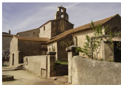
Les bâtiments restaurés du hameau de Celles (avril 2006).