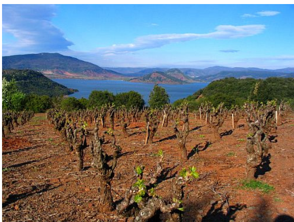
La vigne sur le plateau d'Auverne (avril 2006).