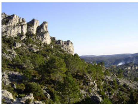
Le relief dolomitique du cirque de Mourèze (mars 2006).

La faune et la flore sont d'une grande richesse et diversité. Les bois de chênes verts et chênes blancs sur les monts, côtoient les formations végétales de garrigue peu dense des versants. Sangliers, perdrix rouge, lapins, renards, blaireaux, rongeurs, couleuvres, sont quelques unes des espèces animales qui colonisent les plaines, les plateaux et les garrigues. Autour du lac de nouvelles espèces floristiques sont apparues. Quant à sa faune, le lac régulièrement empoissonné est reconnu comme un des meilleurs plan d'eau de la région pour ses ressources piscicoles. Dans le Cirque de Mourèze la flore comprend de nombreuses espèces rares ou endémiques.