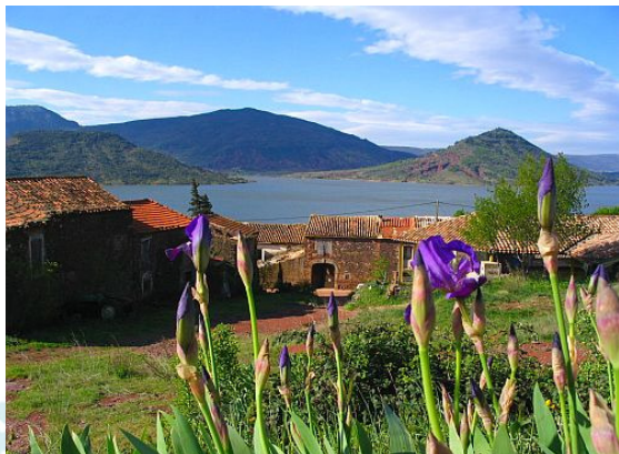
Le hameau des Vailhès, en bordure du lac du Salagou (avril 2006).