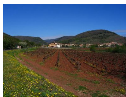
Le village d'Octon, entre plaine agricole et monts d'Octon (avril 2006).

Le paysage bâti est aussi remarquable : l'architecture religieuse (nombreuses chapelles et églises), vernaculaire (capitelles du XIII ème siècle, maisons anciennes en pierre basaltique), civile et militaire témoignent du passé (ruines du péage médiéval du château de Malavieille...).