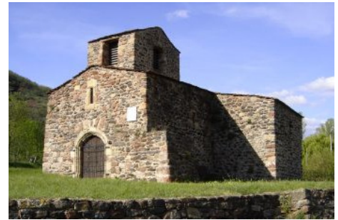
La chapelle romane de Saint-Pierre (avril 2006).

Le moyen-âge est une période rayonnante, autour de la figure de Saint Fulcran, évêque de Lodève au Xème siècle. Il nous a laissé comme traces de nombreuses chapelles, ou encore des vestiges de châteaux. L'époque classique prospère grâce à la production de draps à la manufacture royale de Villeneuve.